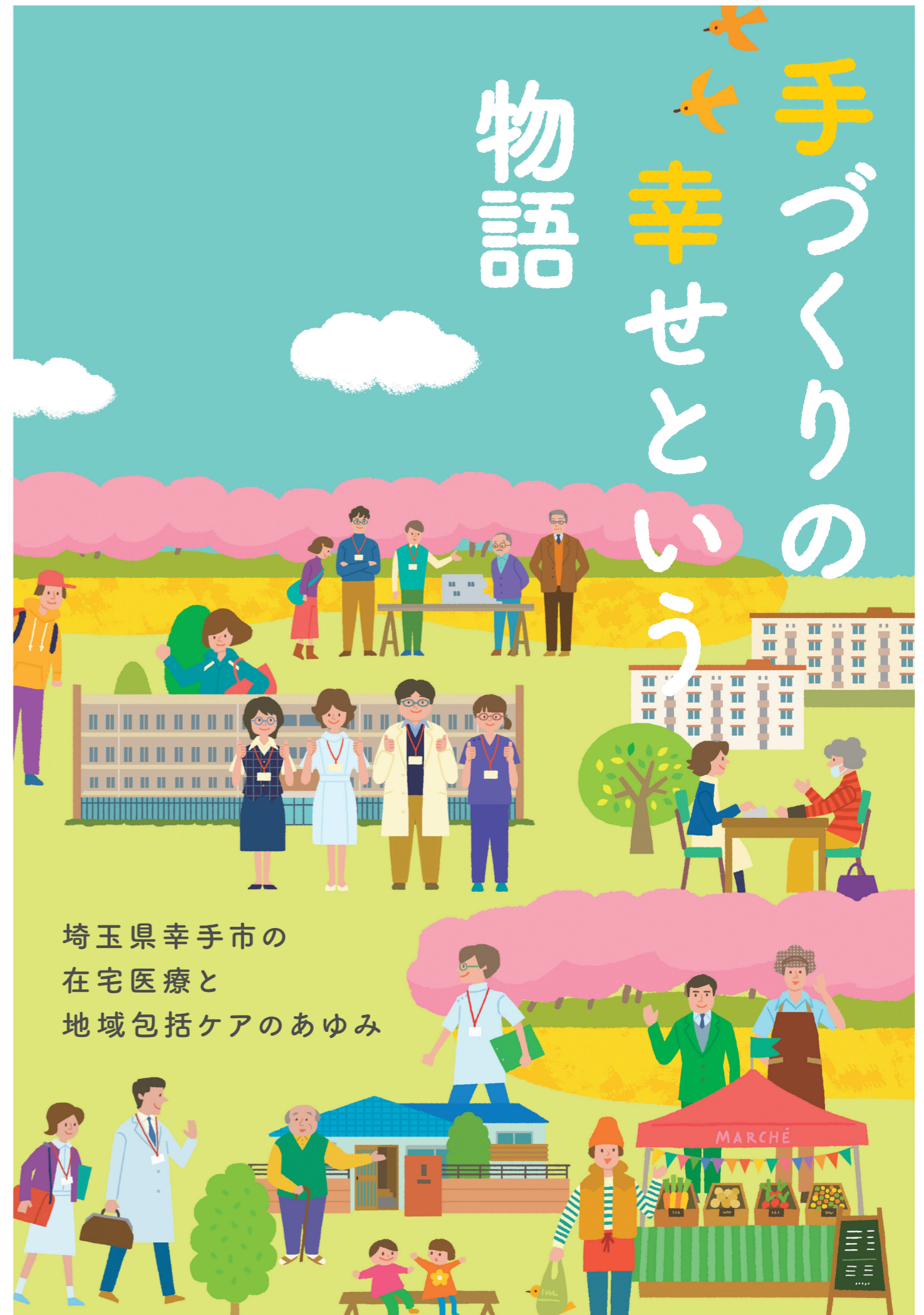
埼玉県幸手市の 在宅医療と 地域包括ケアのあゆみ

菜のはなに関する お問合せはこちらまで 菜のはな 在宅医療連携拠点 社会医療法人ジャパンメディカルアライアンス 東埼玉総合病院 在宅医療連携拠点「菜のはな」 住所: 〒340-0153 埼玉県幸手市吉野517-5 電話: 0480-40-1311 E-mail: nanohana@jin-ai.or.jp この事業は、在宅医療・介護連携推進事業(埼玉県)の助成事業です。